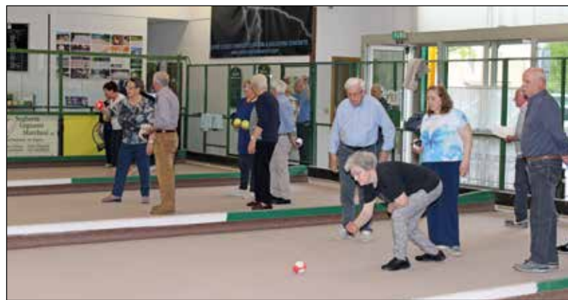
Massima concentrazione per una boccia vincente.

La gara di bocce è un avvenimento, giunto alla quinta edizione, che vede impegnati sedici donne, otto uomini, quattro arbitri e i vari sostenitori degli amici bocciofilo.