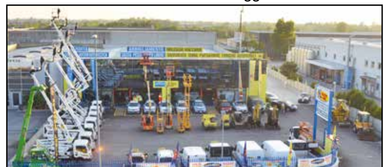
La nuova sede della Noleggio Lorini in zona industriale, via E. Montale 15.

SEDE: MONTICHIARI (BS) - Via E. Montale, 15 FILIALI: CALCINATO - CASTEGNATO tel. 030.9650556 - www.noleggiolorini.com