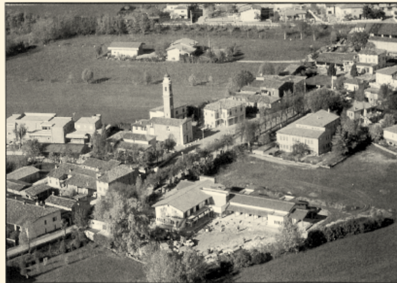
Il centro della vivace frazione di Vighizzolo: la chiesa, le scuole elementari, la nuova scuola materna. Fra le due scuole, l'area sulla quale dovrebbe sorgere la palestra.

gero di ghiaccio riusci perfino a impressionare l'"eroico" Giuseppe. Ma tant'è! Si giocava in quel momento una reputazione di coraggio e di sprezzo del pericolo cresciuta nel tempo e non poteva rinunciare all'impresa. Inoltre aveva