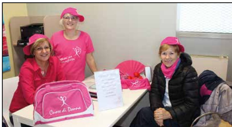
Alcune responsabili dell'Associazione.

"CUORE DI DONNA" è una Associazione che non ha scopo di lucro ed è apolitica, nata dalla forza di un gruppo per sostenere il cammino delle donne che affrontano il tumore al seno e per diffondere la cultura della PREVEZIONE.