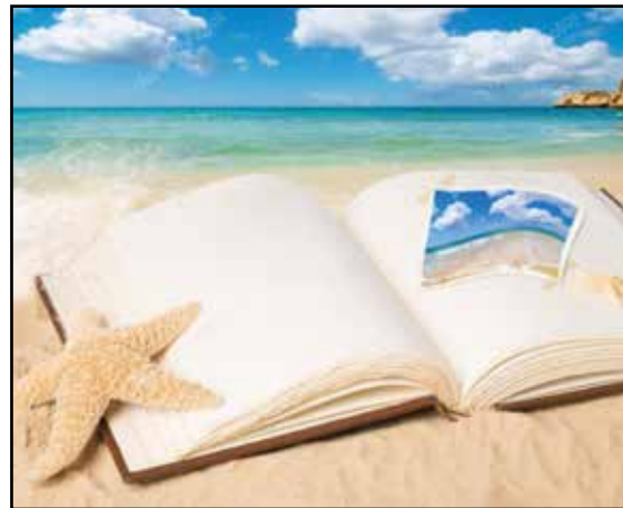
Portati un libro al mare.

Forse i giovani preferiscono gli e-book, ma sfogliare pagine, sentire l'odore della carta, poter scorrere, leggere e rileggere magari qualche pensiero più complesso o più interessante, sottolineare... non ha paragoni!! Regaliamo libri ai nostri bambini, abituandoli così a maneggiarli, a guardare illustra-