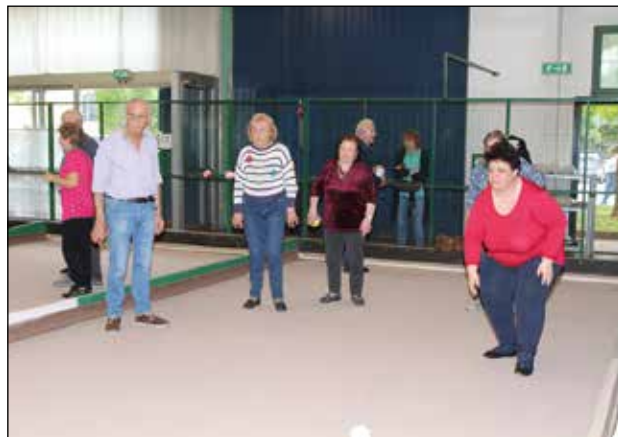
Un tiro per la vittoria.